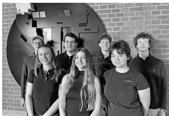
Die Delegation des LG bereitet sich gut vor.