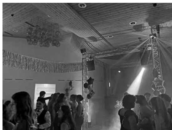
Feiern wie die Stars

Am 28. März versammelte sich die Schulfamilie zum diesjährigen Gymiball im Triesner Gemeindesaal. Unter dem Motto «Oscars Among the Stars» erwartete die Gäste ein glamouröser Abend, der seinem Namen alle Ehre machte.