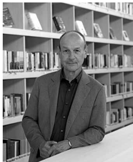
Rektor Eugen Nägele

Im Namen des Rektorats wünsche ich Ihnen alles Gute, erholsame Sommerferien und danke Ihnen für Ihr Vertrauen. Ich wünsche Ihnen viel Lesefreude mit dieser Ausgabe der LGnachrichten.