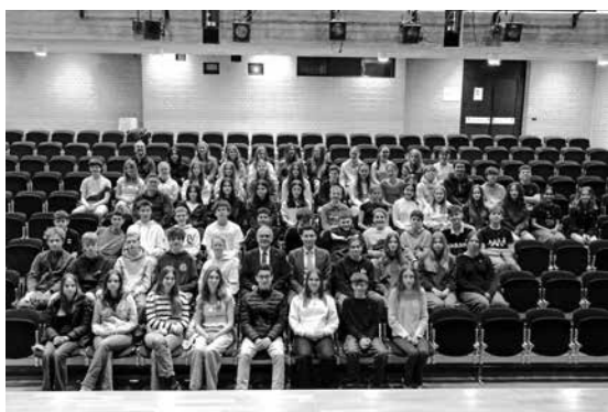
Den Europagedanken verstehen und leben

Dieser Gedanke ist auch eines der zentralen Ziele der berühmten Schuman-Erklärung vom 9. Mai 1950. Deshalb feiern viele Länder in Europa den Europatag, so auch Liechtenstein und das Liechtensteinische Gymnasium.