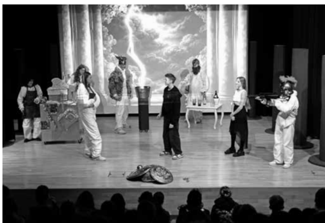
Von der Bühne auf den Olymp und zurück