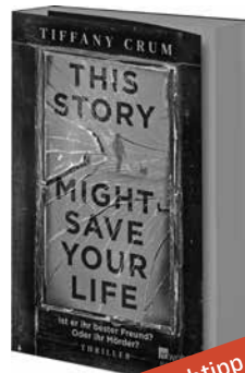
Buchtipp von Fabian