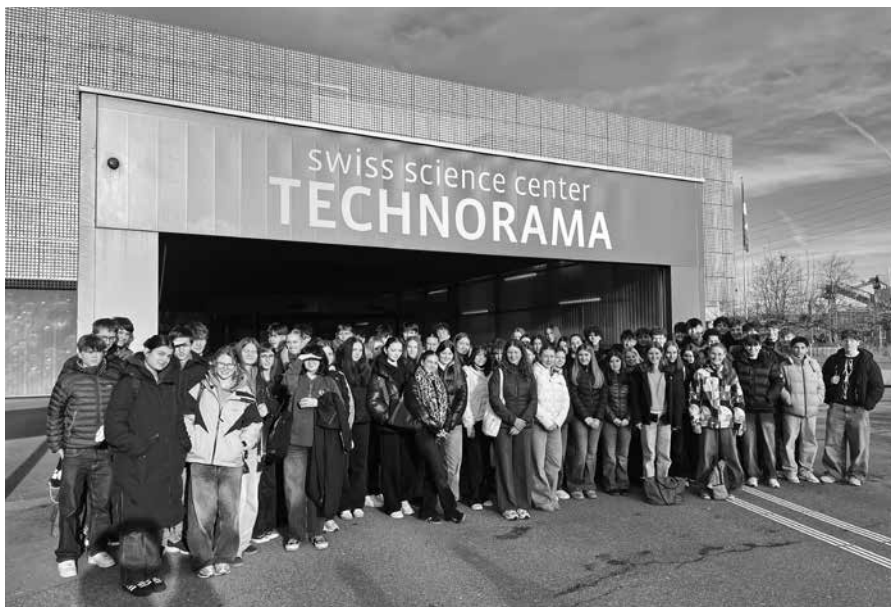
Naturwissenschaften erlebbar machen

Seit einem Jahr trägt das LG Vaduz offiziell das MINT-Label und setzt diesen Impuls konsequent in konkrete Projekte um. Nach den Erfolgen der Schülerinnen und Schüler bei den vergangenen Wissenschafts-Olympiaden konnte mit der Hilti Foundation ein Unterstützer gewonnen werden. Damit bleibt die Teilnahme an Wettbewerben auf nationaler Ebene in der Schweiz sowie international weiterhin gesichert, sodass junge Talente aus Liechtenstein ihre Fähigkeiten unter Beweis stellen können.