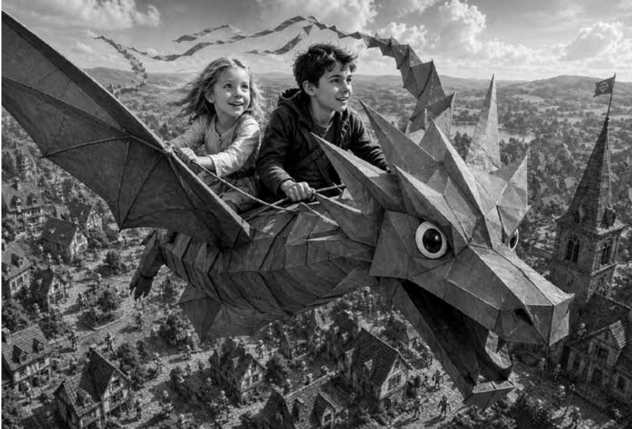
In wichtiger Mission unterwegs

Es war einmal eine glückliche kleine Familie im Lande Lichtenstein, genauer genommen in Schaan. Die Familie bestand aus Mama Linde, Papa Gustav und ihren zwei Kindern Amalia und Alex.