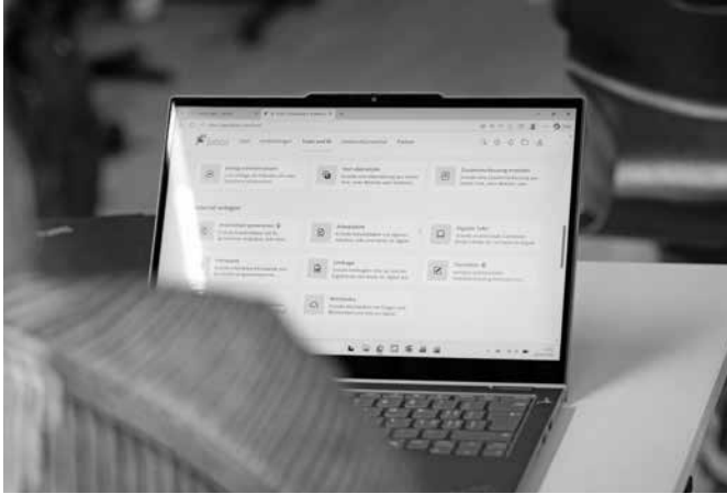
Von und mit KI lernen und lehren