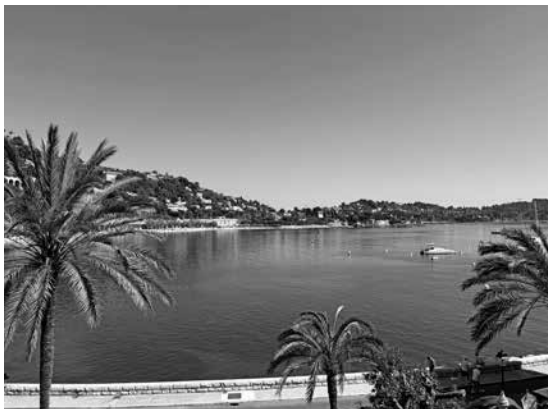
Sprache im Alltag anwenden

Alles in allem waren beide Sprachaufenthalte gelungen und haben mir Spass gemacht, wenn auch die Busfahrten recht zäh waren. Ich konnte sowohl in Frankreich als auch in England neue Bekanntschaften machen und einen Einblick in die Kultur dort gewinnen. Vor allem in Frankreich war ich überrascht, wie gut ich mich verständigen konnte. Ich habe bei beiden Aufenthalten tolle Erfahrungen gemacht und die Zeit sehr genossen.