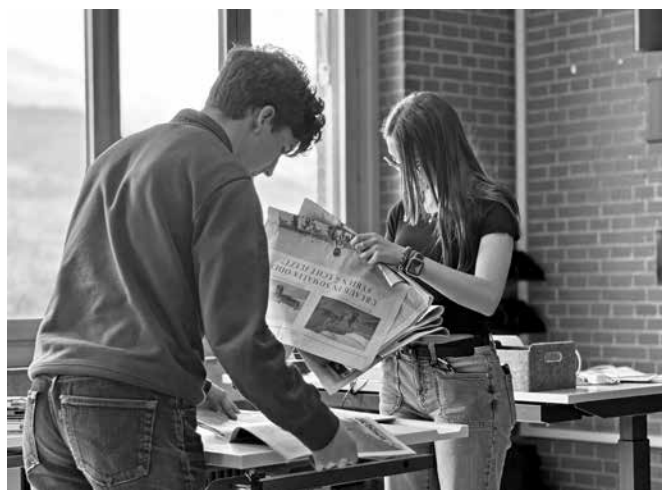
Auf der Suche nach dem richtigen Artikel