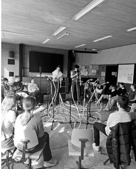
Stimmen sichtbar machen