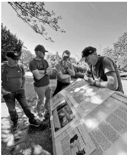
Einblicke vor Ort