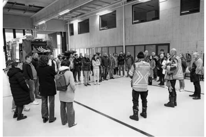
Im neuen Feuerwehrdepot

Wie kann «fobizz», die Plattform für digitale Fortbildungen und KI-Tools für Lehrkräfte, sinnvoll im Unterricht eingesetzt werden? Welche Rolle spielt KI bei der Gestaltung von Unterricht und Unterrichtsmaterialien? Wie können Lehrpersonen die differenzierte Anwendung dieses Angebots erproben? Mit diesen und weiteren Fragen beschäftigte sich das Kollegium des LG im Rahmen der SCHILF am Donnerstag, den 2. April 2026.