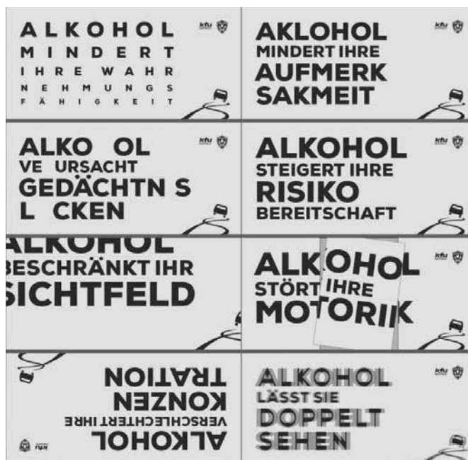
Den Kopf eingeschaltet lassen

Ein zentrales Anliegen des Workshops war es, den Blick zu weiten: Nicht nur Alkohol stellt am Steuer ein Risiko dar. Auch Müdigkeit, Ablenkung oder die Einnahme bestimmter Medikamente können die Fahrfähigkeit erheblich einschränken, Aspekte, die im Alltag oft unterschätzt werden. Die Botschaft der Organisation bringt es dabei klar auf den Punkt: Wer fährt, ist fahrfähig, fit und fokussiert.