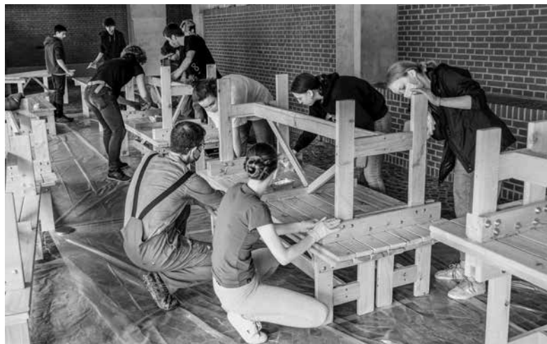
Die Bänke werden zusammengebaut