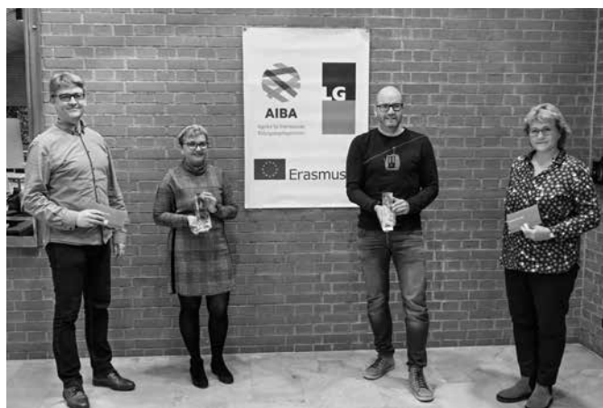
Auszeichnung für das LG: Erasmus-Award