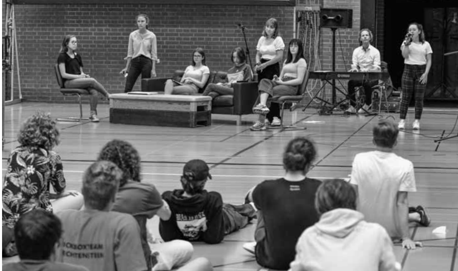
Die Einstimmung auf das Schuljahr findet in der Turnhalle statt