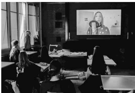
Weihnachtsbesinnung als Livestream