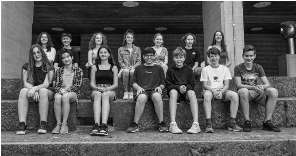
Vorstand der SOS