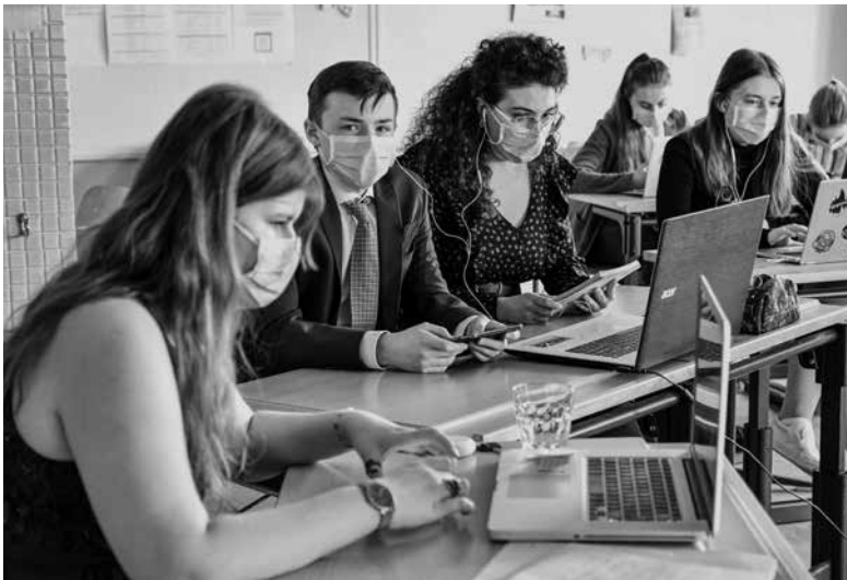
Das YPAC findet online statt