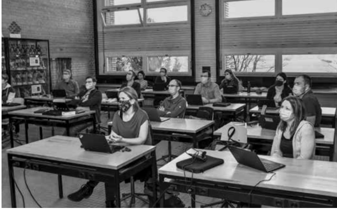
Zuhören und dann selber ausprobieren