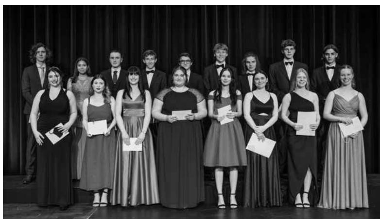
Maturandinnen und Maturanden mit Notenschnitt 5 plus