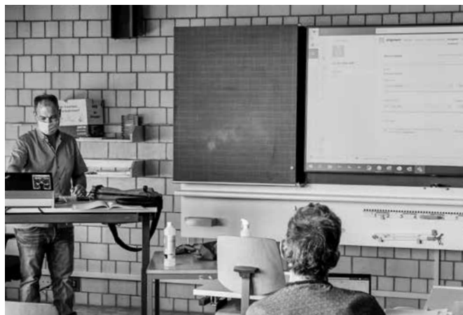
Best practice an der SCHILF