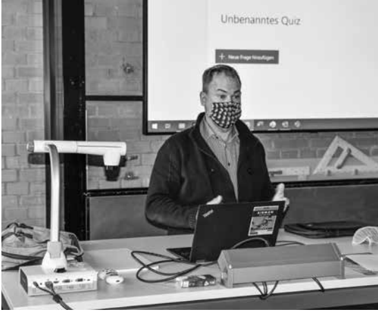
Voneinander lernen im Rahmen der LLK