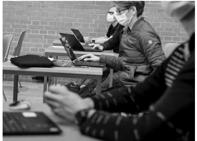
Weiterbildung für die Lehrpersonen

Ein schwieriges und spannendes Thema, das die Schule mit grösster Wahrscheinlichkeit in den nächsten Jahren vermehrt beschäftigen wird, dürfte auch die Frage bilden: «Wie ist der Daten-