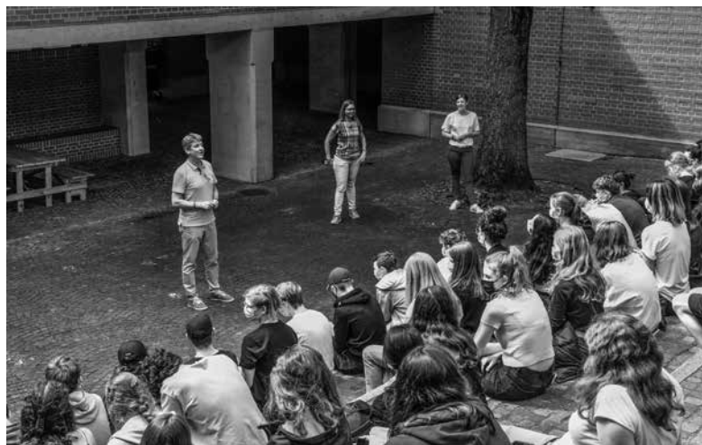
Impressionen vom Klima-Tag am LG