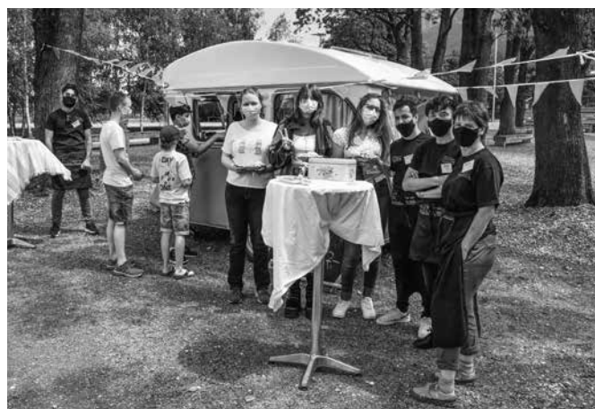
Gymi for Change und die Nepalhilfe vor dem LG