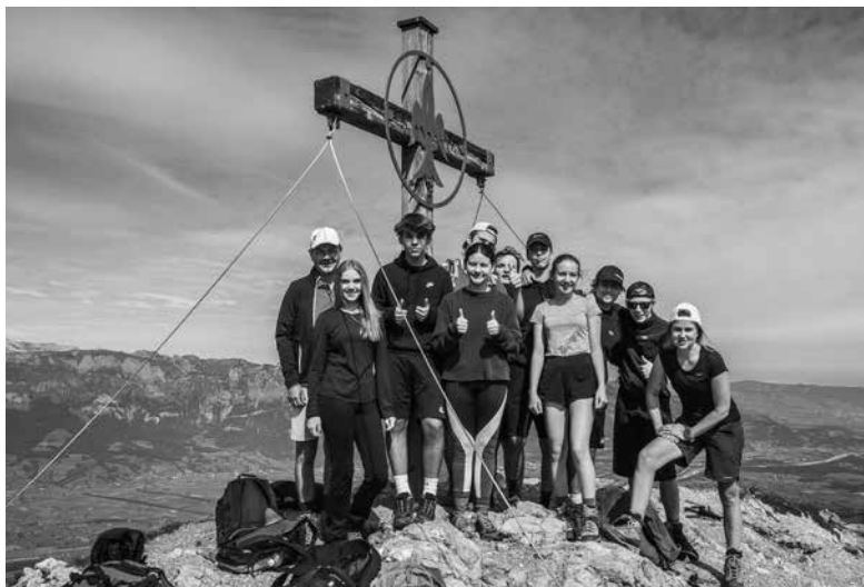
Wandertag der 5La