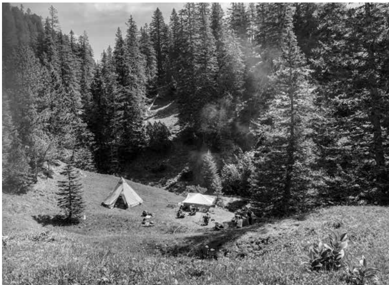
Bild aus dem Wahlfach 4 Jahreszeiten Biwak