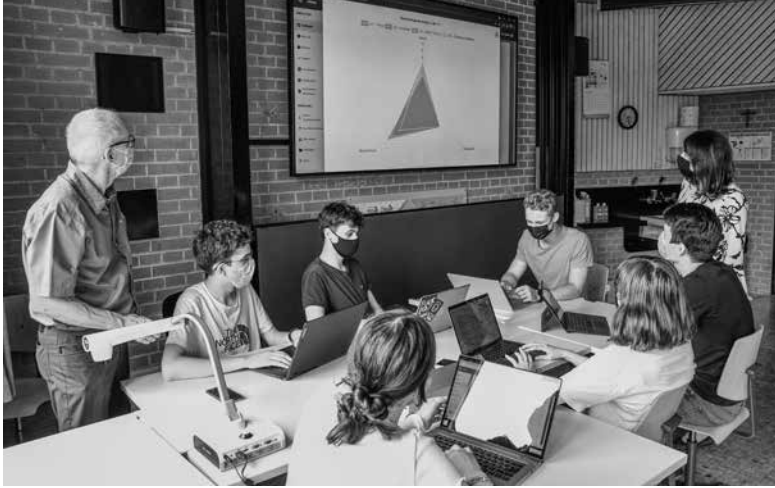
Die Wirtschaftswoche findet am LG statt