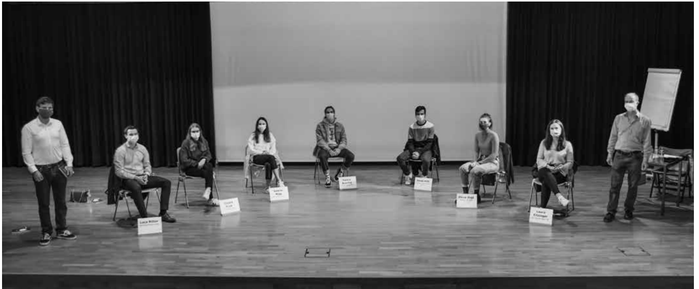
Der Anlass vom ABB findet coronabedingt in der Aula statt