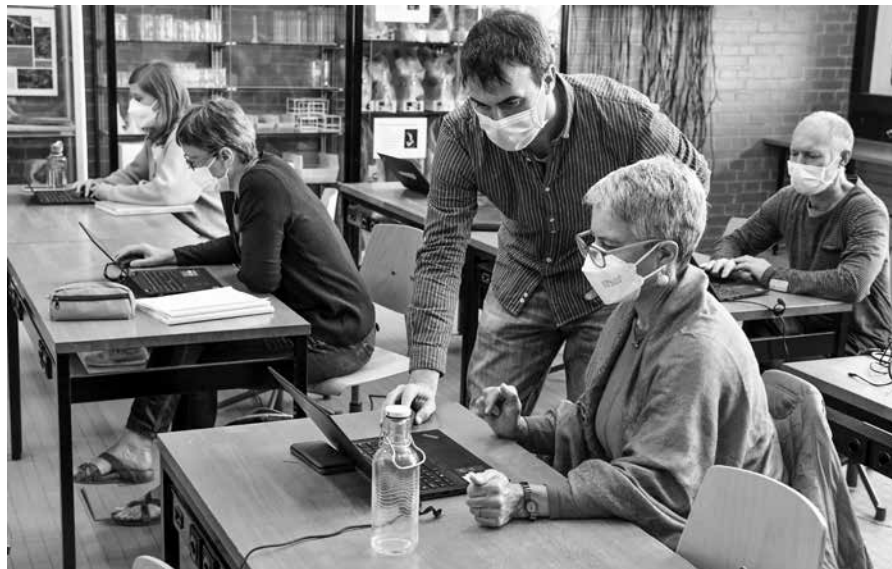
Kollegiale Unterstützung im Umgang mit den Laptops

In der letzten Woche der Sommerferien im August 2020 wurden alle Lehrpersonen des Liechtensteinischen Gymnasiums mit Laptops (Convertibles) ausgestattet.