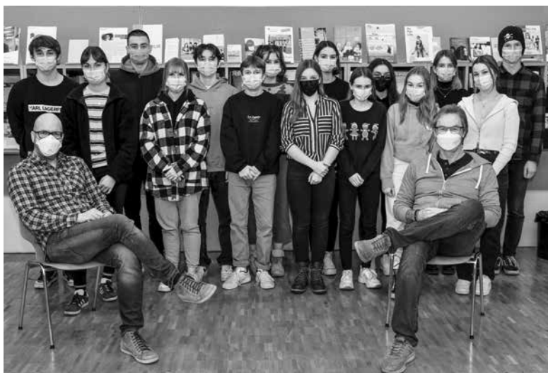
Die Verantwortlichen für die Weihnachtsbesinnung