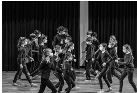
Impressionen aus der Erzählacht