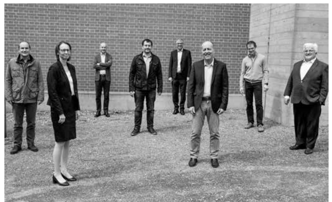
Die neu bestellte Maturakommission