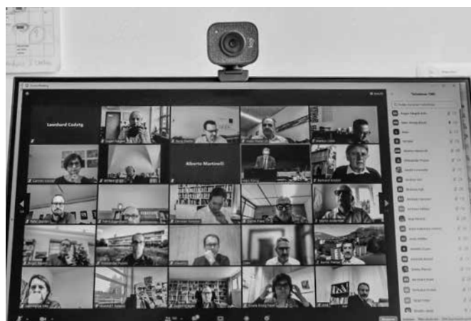
Die jährliche Konferenz Schweizerischer Gymnasial-Rektoren findet nur online statt