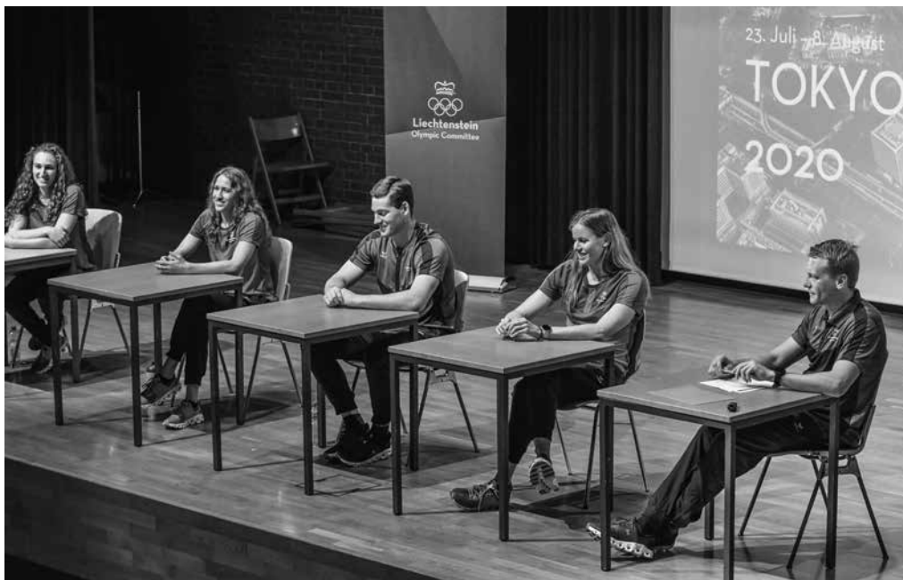
Ehemalige der Sportschule berichten vor der Abfahrt nach Tokyo