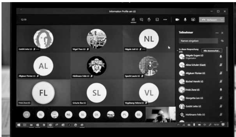
Der Informationsabend über die Profile findet online statt