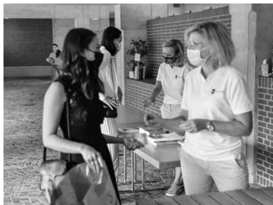
Kohle für Bücher