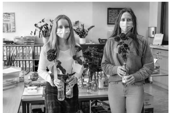
Die Röslektion war so erfolgreich wie nie zuvor