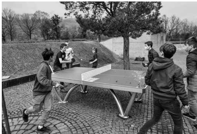
Die EVLG sponsert einen Tischtennistisch für das LG