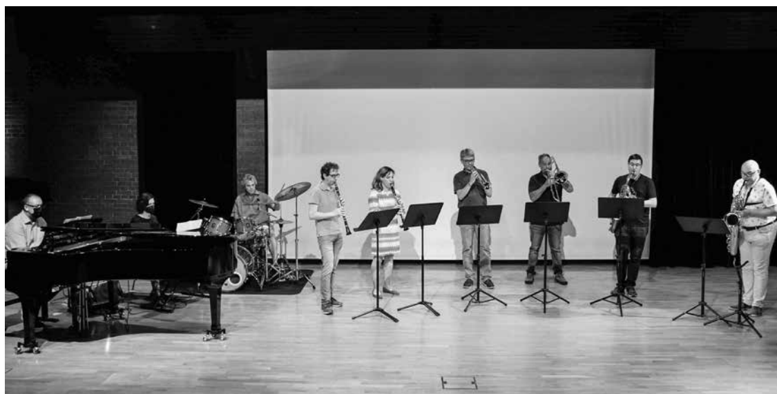
Musikalischer Hochgenuss zum Abschied