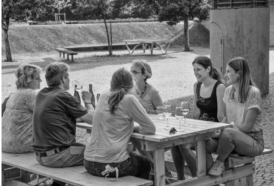
Gemeinsamer Ausklang nach Unterrichtsschluss am letzten Schultag

Das haben wir uns alle etwas anders vorgestellt. An der letztjährigen Generalversammlung war die Welt noch in Ordnung, das blöde Virus ein kleiner Beitrag in der zweiten Hälfte der Tagesschau, wir freuten uns auf gesellige Anlässe und setzten uns mit den Chancen aber auch Problemen der Digitalisierung auseinander.