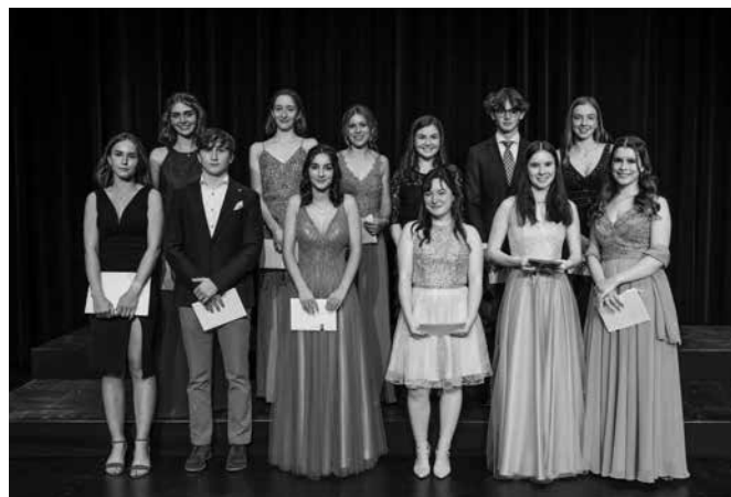
Maturandinnen und Maturanden mit Notenschnitt 5 plus