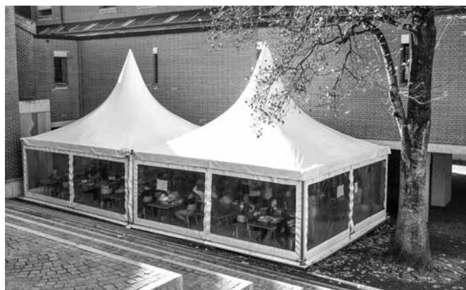
Das LG vergrössert die Mensa und trägt zu den Schutzmassnahmen bei