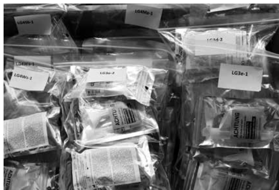
Die Durchführung der Spucktests generiert einen grossen Zusatzaufwand in der Verwaltung