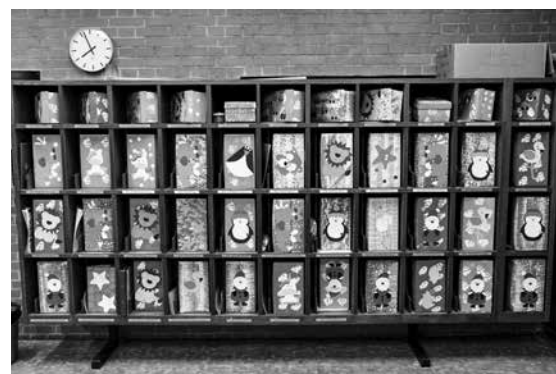
Weihnachten – YANA bringt Geschenke