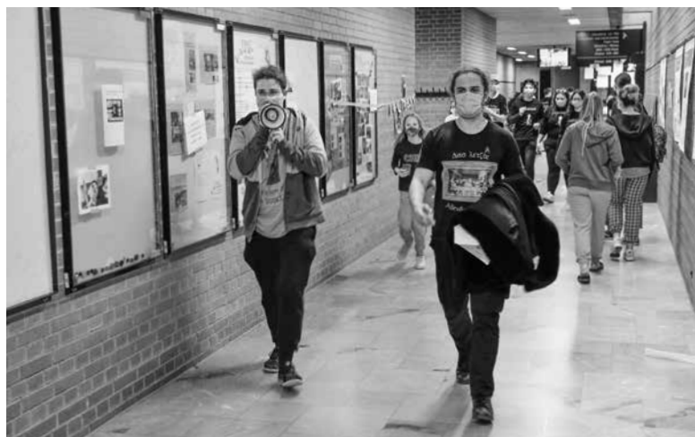
Letzter Schultag der Maturaklassen