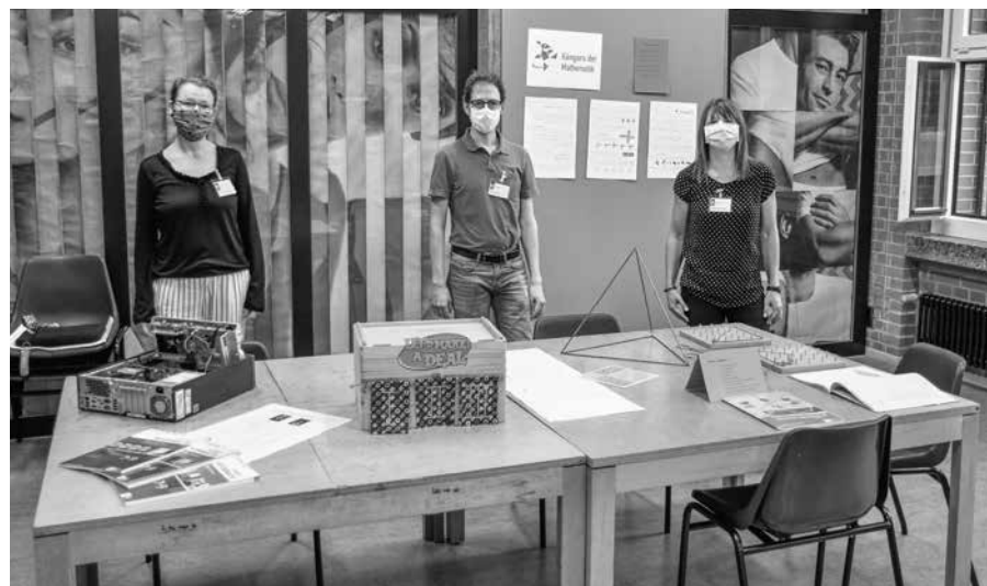
Der Stand der Fachschaft Mathematik