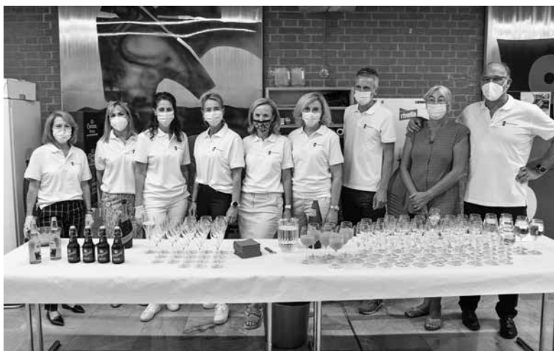
Alle Helferinnen und Helfer beim Matura-Apéro