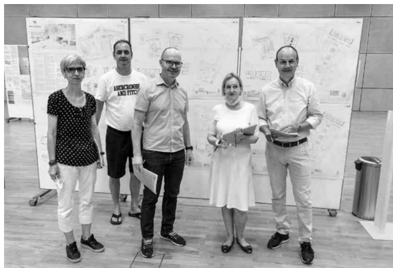
Die LG-Delegation bei der Vorprüfung der Baueingaben