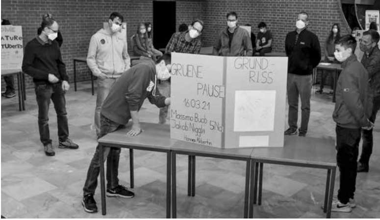
Präsentation einer Mappe