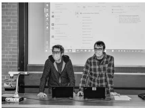
Einführung in das OneNote-Notizbuch.