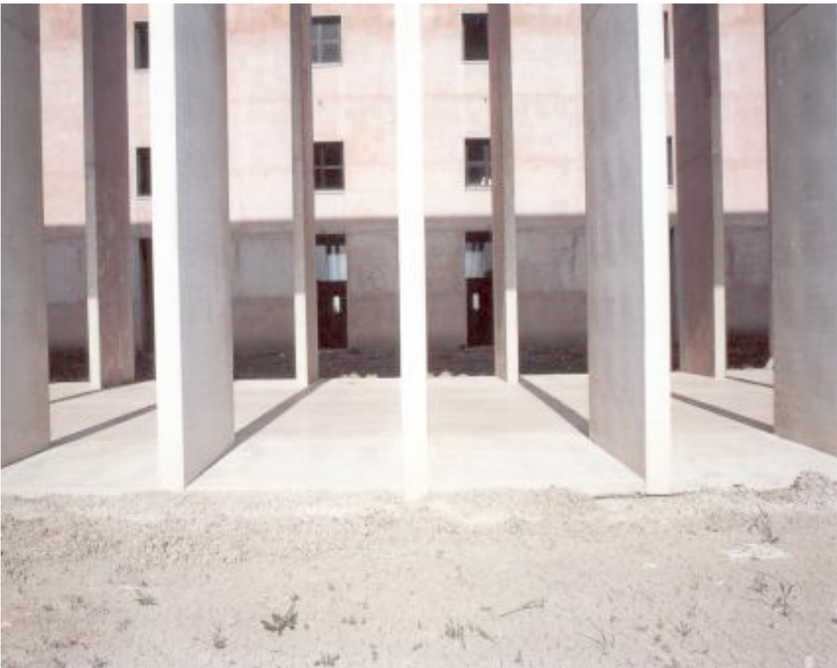
Vorhergehende drei Abbildungen: Wohnblock Galaratese in Mailand, 1970, Architekt: Aldo Rossi